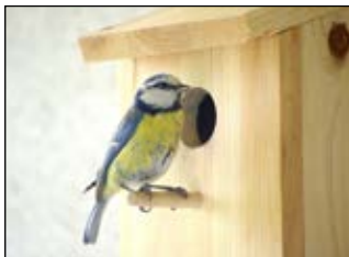
Nistkasten mit Blaumeise

Sicher, in der freien Natur werden Nisthöhlen auch nicht einfach von Zauberhand sauber. Warum also sollten Nistkasten gereinigt werden? Aus demselben Grund, weshalb man sie aufgehängt: zum Vogelschutz. Denn die Kästen werden auch als Schlafplätze benutzt und sollen im nächsten Jahr wieder eine Vogelfamilie beherbergen. Altes Nistmaterial, tote Vogeljungen und vor allem Parasiten (Vogelflöhe, Milben, Zecken) stören da sehr.