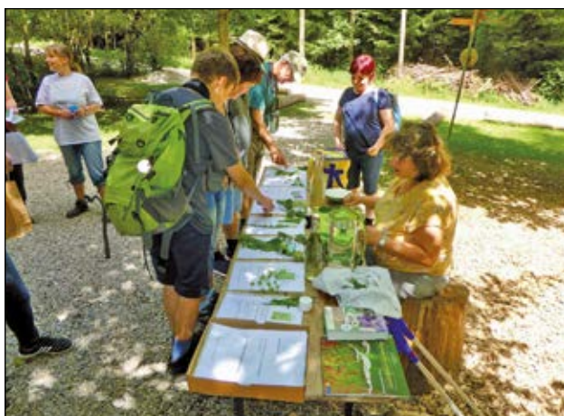
Im Fuchsentanz Egolzwil wurden viele Informationen zu den gesammelten Wildpflanzen zur Verfügung gestellt und die Pflanzen dann auch noch zu einer feinen Dippssauce verarbeitet.

Text: Florian Weingartner