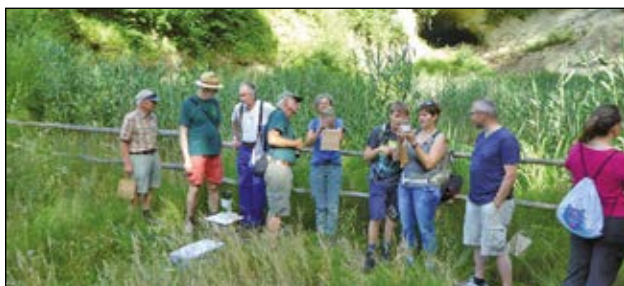
In der Sandgrube Wauwil wurden Wasserlebewesen aus dem Teich studiert.

Auch interessiert an unserer Natur? Unter www.navowauwilegolzwil.ch findest du weitere In- formationen zu unserem Verein und unseren Aktivitäten.