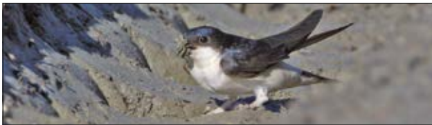
An einer feuchte Dreckstelle, die in jedem Garten und auf jedem Bauernhof Platz hat, finden Mehlschwalben Nistmaterial.