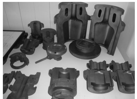
Zentraler Formenbau in Wauwil