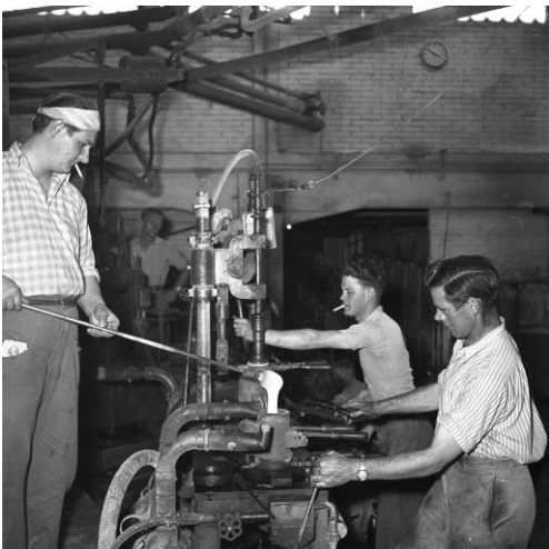
Mundblasen und Halbautomaten